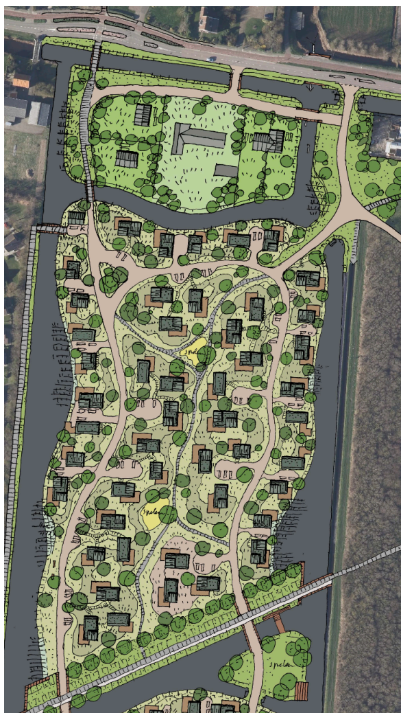
Figuur 7: inrichtingsschets

Buiten de paden waarop auto's kunnen rijden worden smallere paden gemaakt uitsluitend voor wandelaars en fietsers. Ook zullen er olifantenpaadjes kunnen ontstaan waar dat in de praktijk blijkt gemakkelijk te zijn. Deze laatste zeer smalle paadjes worden bewust niet gepland. Bewegwijzering zal gericht zijn op lopen en fietsen naar het vermaak en naar het strand. Uiteraard komen er ook bordjes om de woningen te kunnen (terug)vinden.