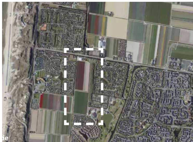
Figuur 1: ligging van Noorderduyn

In deze notitie wordt de ontsluiting en bereikbaarheid van het recreatiepark nader toegelicht. Noorderduyn wordt gerealiseerd tussen de parken Keizerskroon aan de oostzijde, het westelijk gelegen vakantiepark Strandslag Julianadorp en het eveneens zuidelijk en oostelijk gelegen Landal Beach Resort Ooghduyne. De situering op het, tot op heden, lege perceel tussen de bestaande parken biedt niet alleen de mogelijkheid om het netwerk van loop- en fietsroutes tussen Julianadorp en het strand te verbeteren, maar het optimaliseert ook de onderlinge verbindingen tussen de omliggende parken. In figuur 1 is de ligging van Noorderduyn in zijn omgeving te zien.