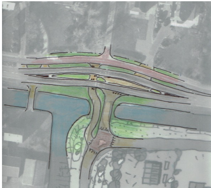
Figuur 5: Westelijke Aansluiting Noorderduyn aan Van Foreestweg

De gemeente eist dat fietsers gescheiden van de auto moeten kunnen oversteken. In figuur 5 wordt de aansluiting met nieuwe brug geschetst voor gecombineerd gebruikt door auto- en fietsverkeer naar Noorderduyn en naar de volkstuinen