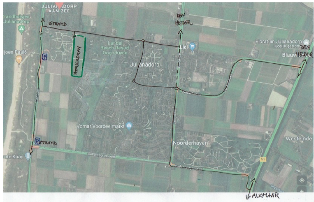
Figuur 4: variant 2 met noordelijke ontsluiting aan Van Foreestweg

In variant 2 vervalt de mogelijkheid om via Noorderduyn aan de zuidzijde een verbinding te geven naar Ooghduyne, omdat het recreatiecentrum daar niet aan mee wil werken (figuur 4). De ontsluiting aan de Van Foreestweg wordt daarmee de ontsluiting van Noorderduyn.