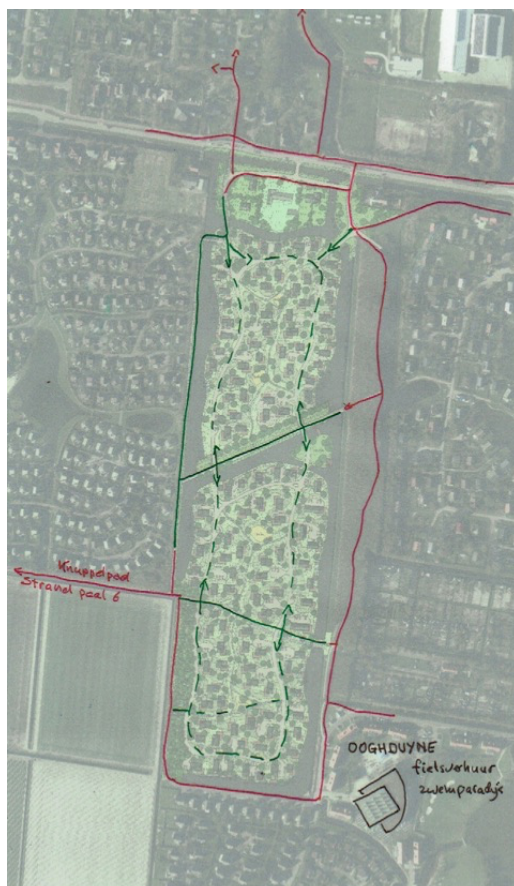
Figuur 2: fietsroutes met nieuwe schakels (groen)

In figuur 2 zijn de verbindingen voor lopen en fietsen in kaart gebracht en is te zien dat Noorderduyn zorgt voor verbeteringen van het fietsnetwerk in het gebied tussen Julianadorp en de kustweg.