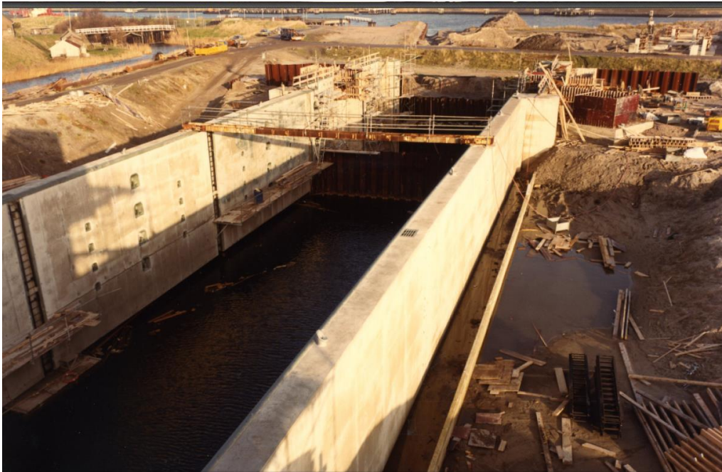
Afbeelding 13: sfeerfoto bij aanleg sluis.