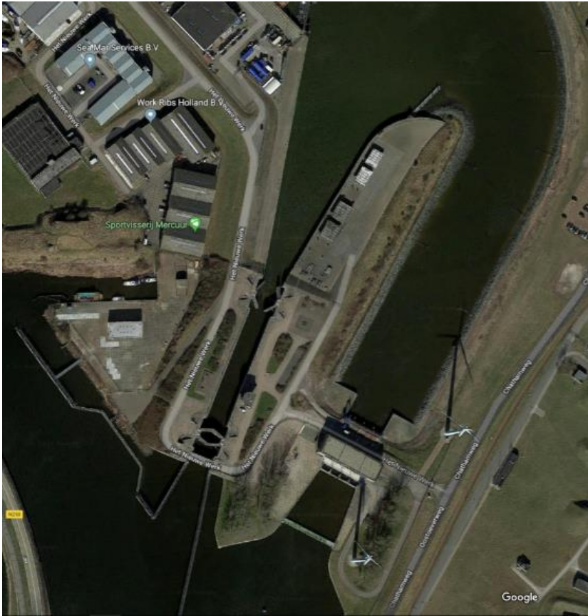
Afbeelding 1: luchtfoto huidige situatie.