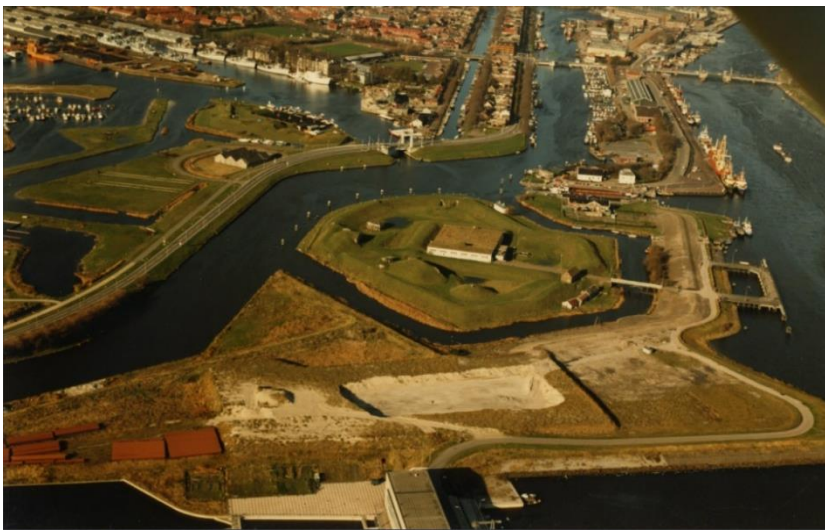
Afbeelding 2: Luchtfoto bij aanvang werkzaamheden.