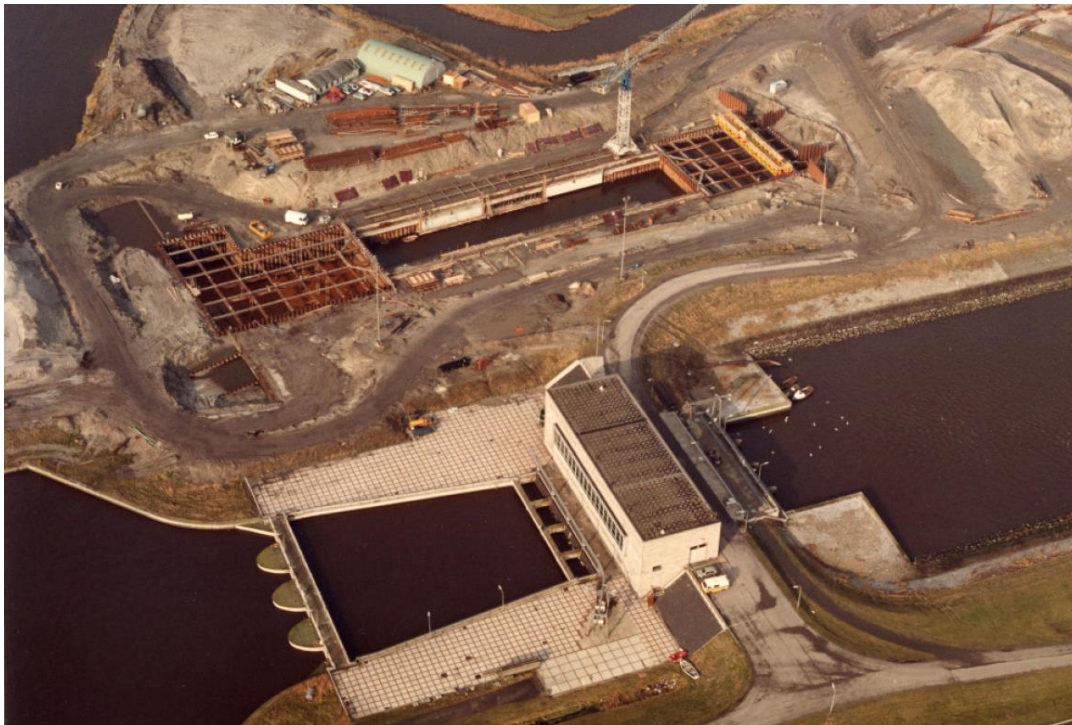
Afbeelding 8: overzichtsfoto aanleg damwanden.