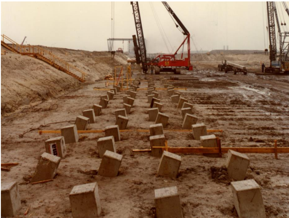
Afbeelding 6: aanleg paalfundering.