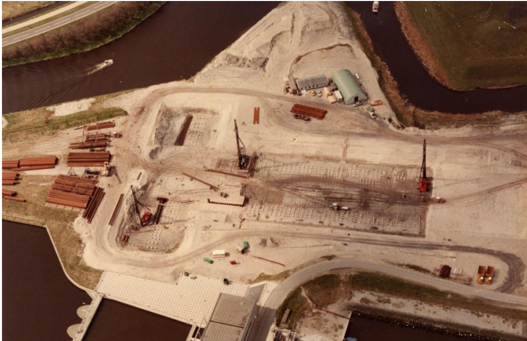
Afbeelding 7: overzichtsfoto aanleg paalfundering.