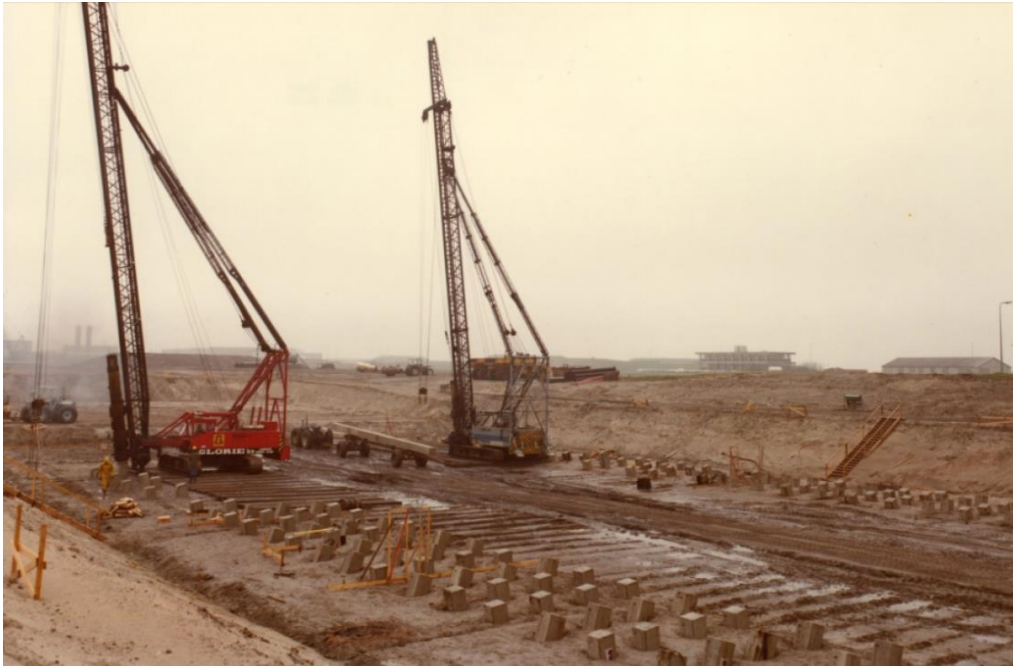
Afbeelding 5: aanleg paalfundering.