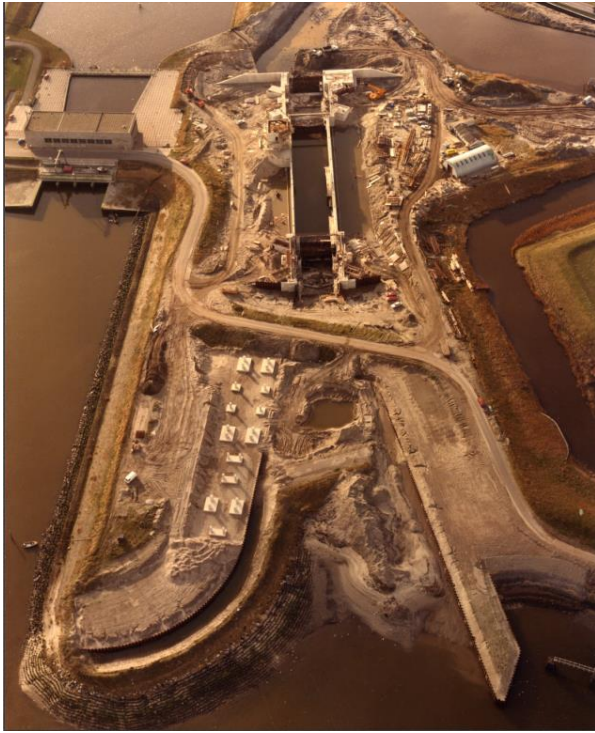
Afbeelding 11: overzichtsfoto werkterrein bij aanleg sluis.