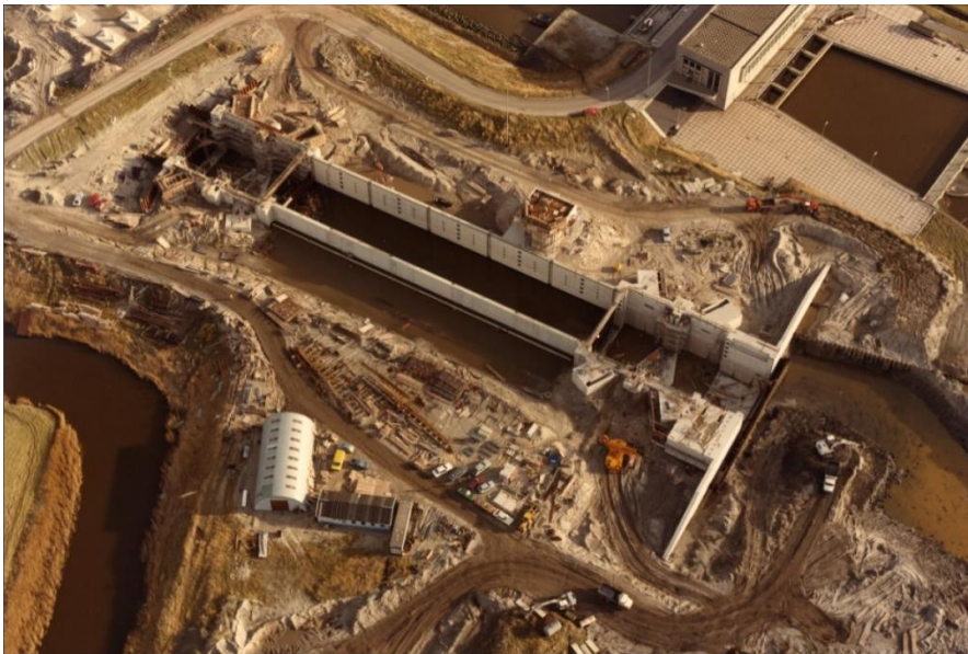
Afbeelding 12: overzichtsfoto werkterrein bij aanleg sluis.