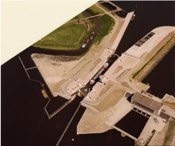
Afbeelding 3: overzichtsfoto na ingebruikname van de KVSS.