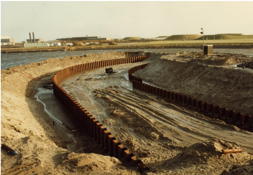
Afbeelding 14: sfeerfoto bij aanleg oever noordzijde.