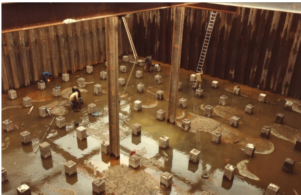
Afbeelding 10: sfeerfoto aanleg damwanden.