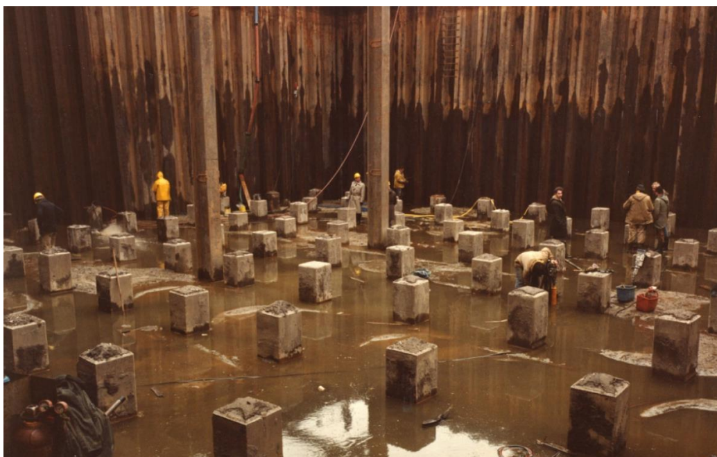
Afbeelding 9: sfeerfoto aanleg damwanden.