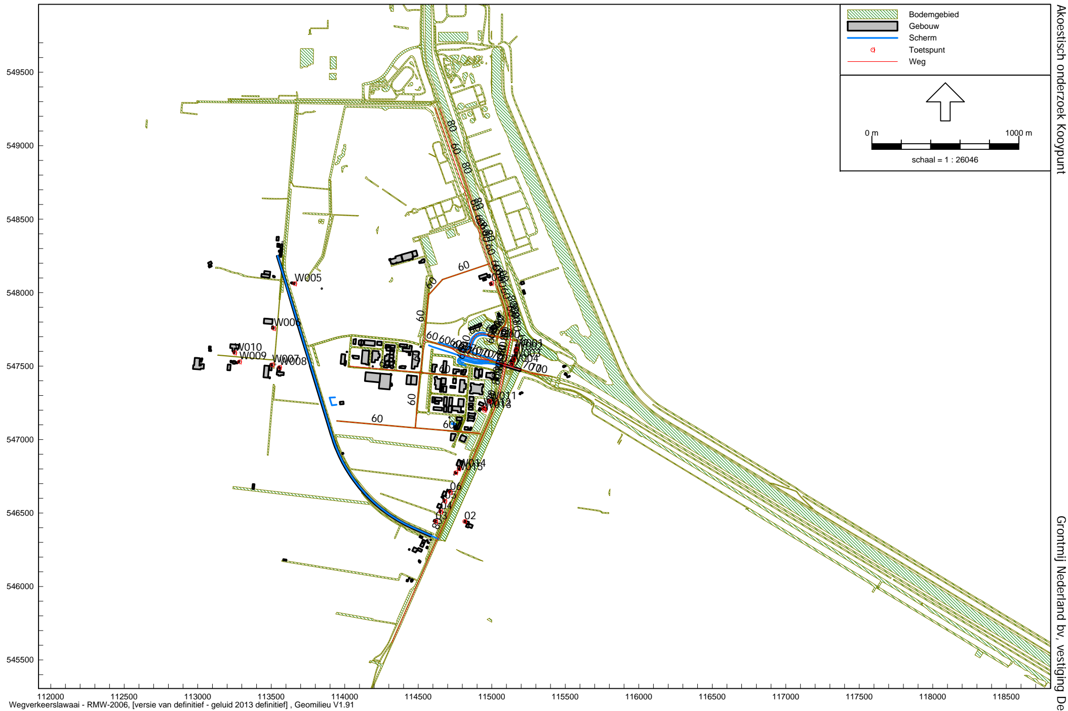
Ingevoerde bronnen objecten en ontvangers