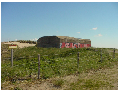
Foto van de bunker

De bunker waar de radarmast op gepland is, valt binnen het bestemmingsplan "Duinreep 2003" en heeft daarin de bestemming "Waterkering/natuurgebied" en de nadere aanduidingen "natuurmonument" en "historisch verdedigingswerk". De bunker van het type M219 is gelegen bij de strandopgang de Zandloper in het duingebied. Ten zuiden van de bunker is nog een bunker gelegen. Deze dient al jaren als uitkijkpost voor het publiek.