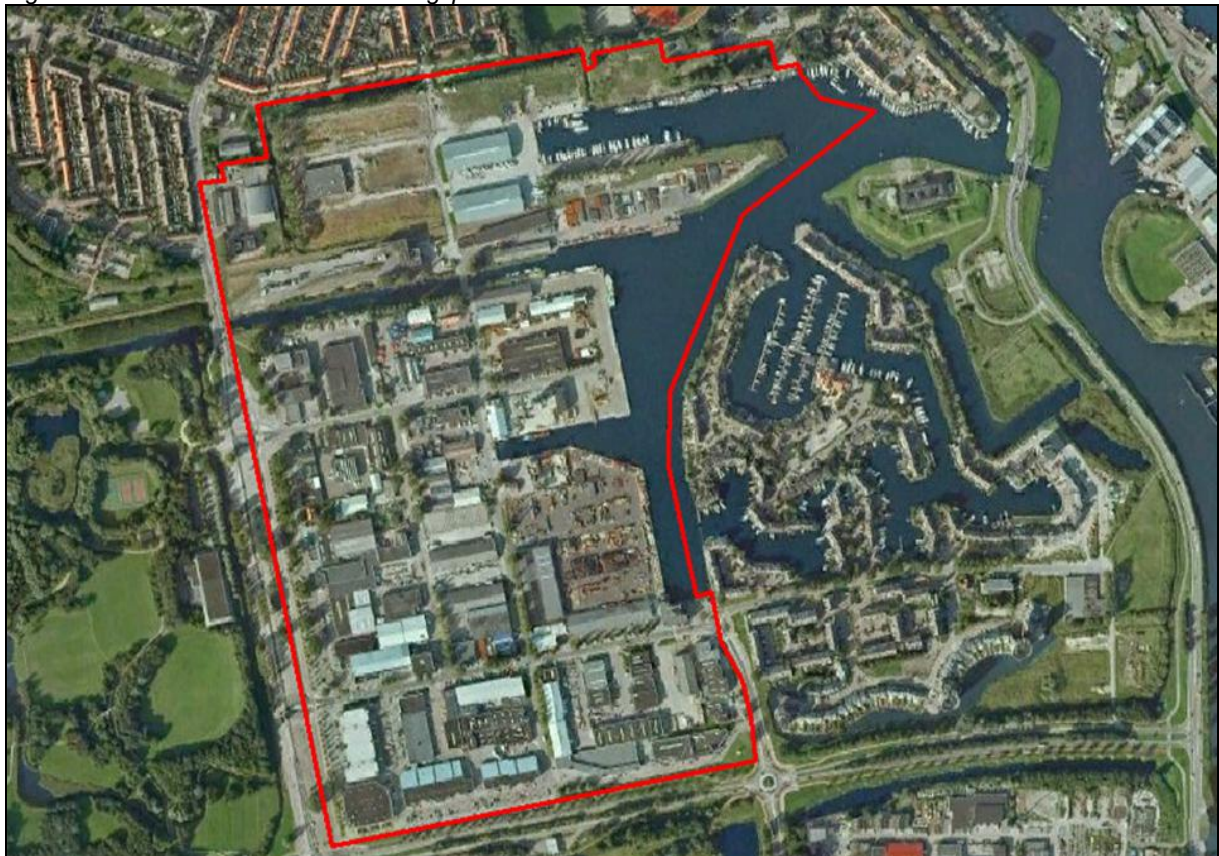
Figuur 1.1: Situatieoverzicht bestemmingsplan "Westoever 2011"

Het bedrijventerrein Westoever ligt ingeklemd tussen de woonwijk Boatex en de Schootenweg.