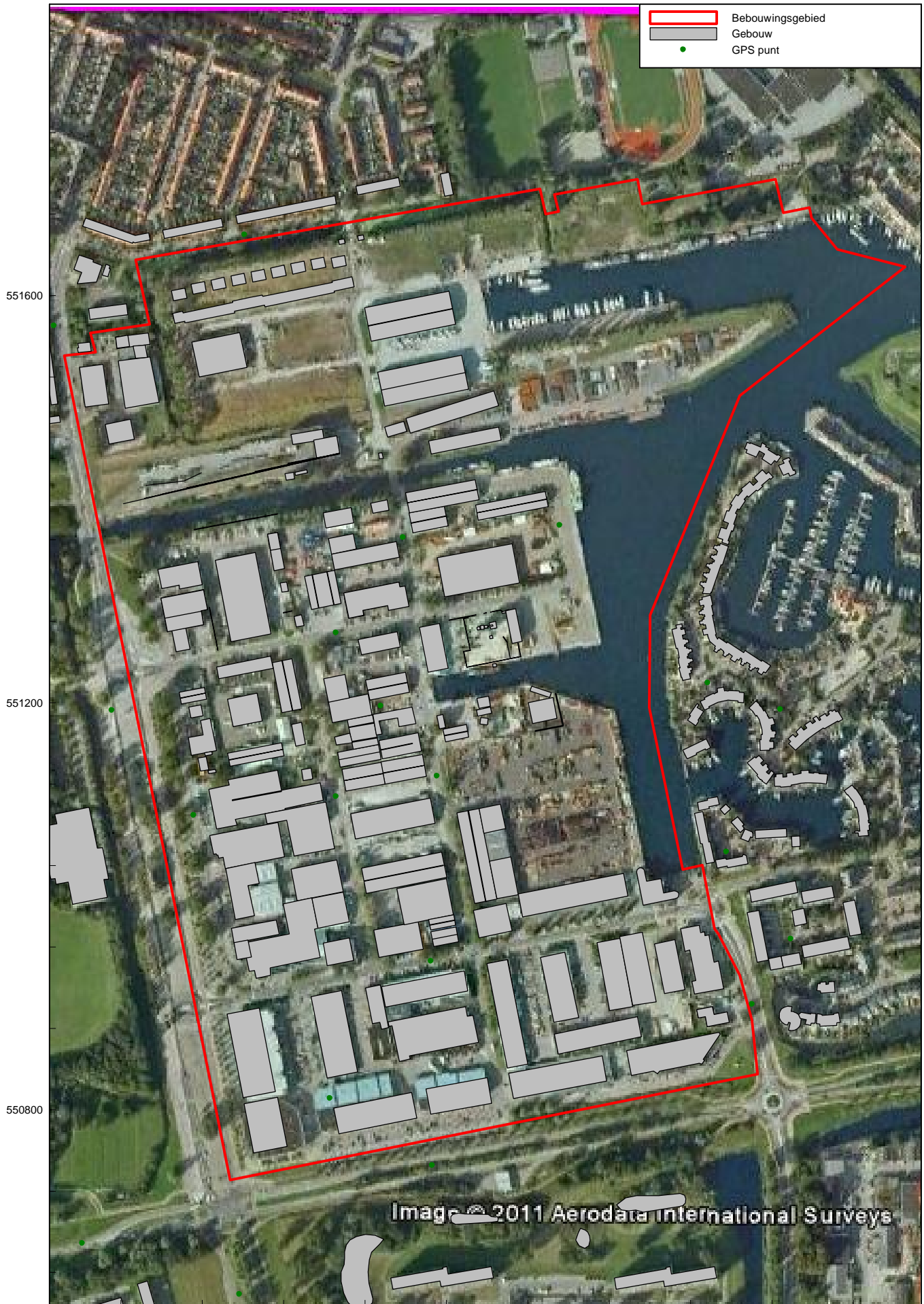
Overzicht situatie Bestemmingsplan Westoever 2011