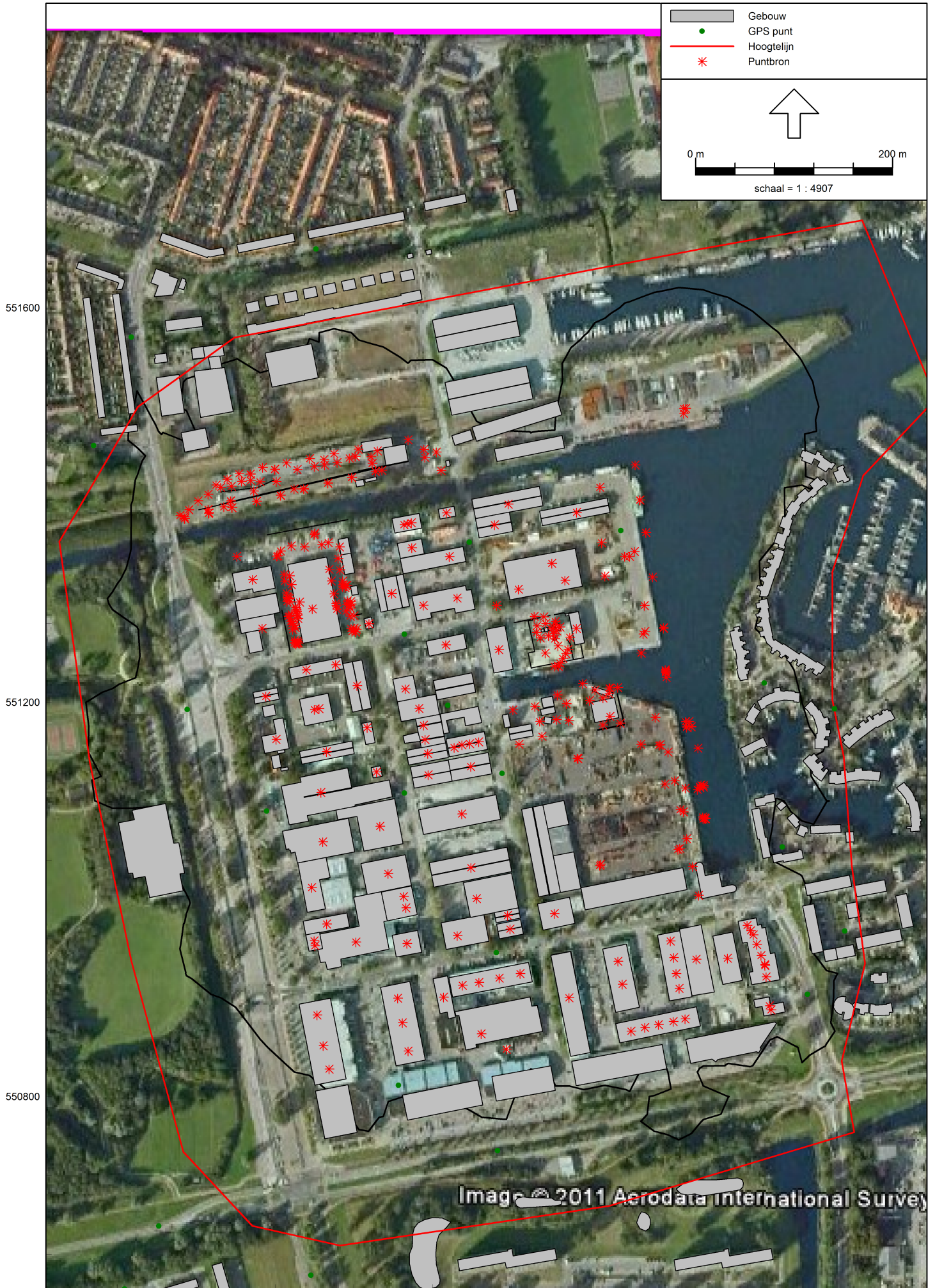
Ligging zonegrens en 50 dB(A) contour Westoever