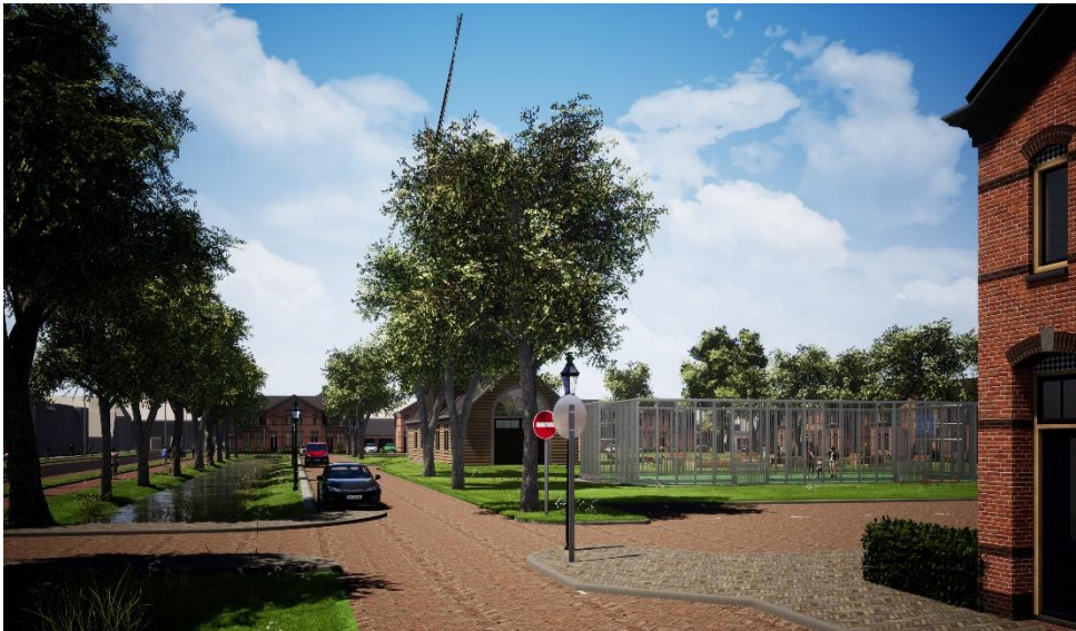
Zicht op Vinkenterrein richting Ruyghweg

Bewoners aan de Ruyghweg, die nu hun achtertuin op het noorden hebben, kunnen via de gemeente Den Helder grond bijkopen. Zij ontvangen daarover nog apart informatie. Voorwaarde is wel dat alle bewoners meedoen, anders geeft het een rommelig beeld met de ene tuin die langer is dan de andere ernaast. Helaas lukt grondverkoop niet aan de achterzijde van de Sluisdijkstraat. Dan blijft er te weinig ruimte over voor achtertuinen van de nieuwe woningen. De nieuwbouw naar voren opschuiven kan niet, omdat ze in lijn moet blijven met de Janzenstraat en op voldoende afstand van de molen.