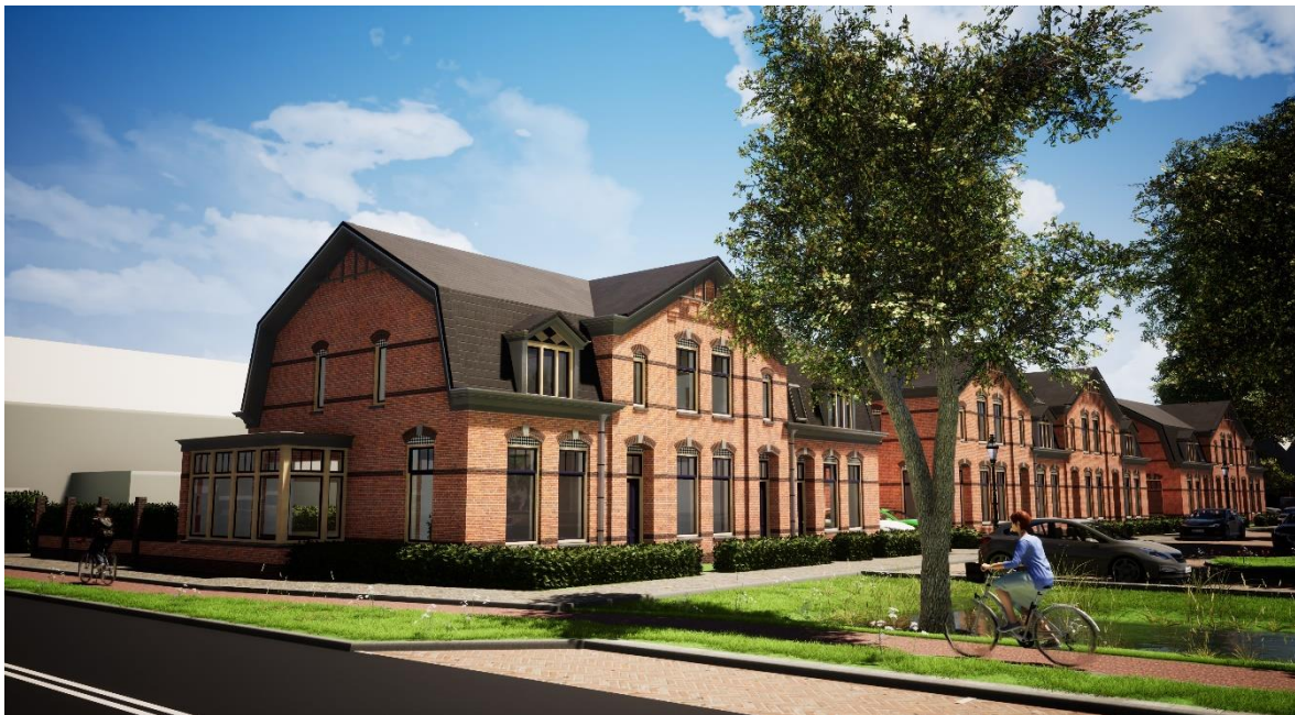
Impressie van de nieuwe woningen achter de huizen aan de Ruyghweg, gezien vanaf de Fabrieksgracht.

In deze nieuwsbrief informeren wij u graag aan de hand van een aantal vragen over het plan Vinkenterrein. Daarnaast bent u van harte welkom op de informatieavond, de uitnodiging ontvangt u hierbij. Mocht u ook daarna nog vragen hebben, dan kunt u altijd terecht bij [REDACTED] van de gemeente Den Helder [REDACTED] of [REDACTED] van Woningstichting/Helder Vastgoed BV ([REDACTED]).