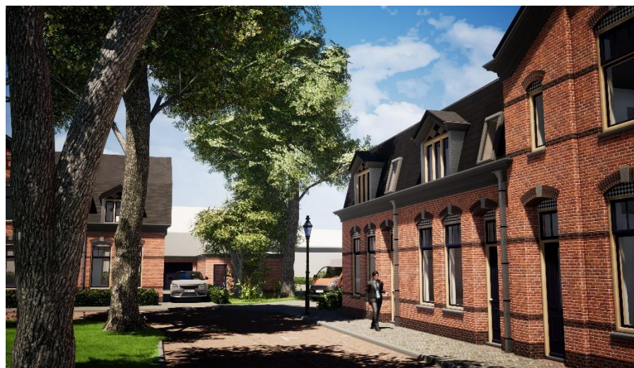
Impressie van de zuidwesthoek, met doorgang naar het terrein met garages.