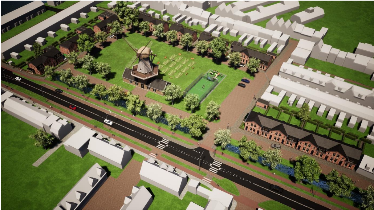
Impressie van de totale herinrichting van het Vinkenterrein.

Dat blijft een groen speel- en verblijfsgebied. De bedoeling is dat hier behalve de speelkooi in elk geval heemtuinen komen: een met lage beplanting omzoomd terrein met bakken, waar leerlingen van scholen en buurtbewoners groente en andere gewassen kunnen kweken. De invulling van de rest van het terrein staat nog niet vast. Of het blijft gewoon een groen grasveld. De bestrating van de wegen gebeurt met fraaie klinkers en ook wordt er straatmeubilair (zoals lantaarnpalen) geplaatst dat past bij de stijlvolle architectuur van de woningen.