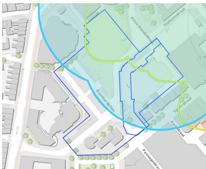
Risicogebied 1: Afwerpmunitie, blauwe lijn met licht blauwe arcering