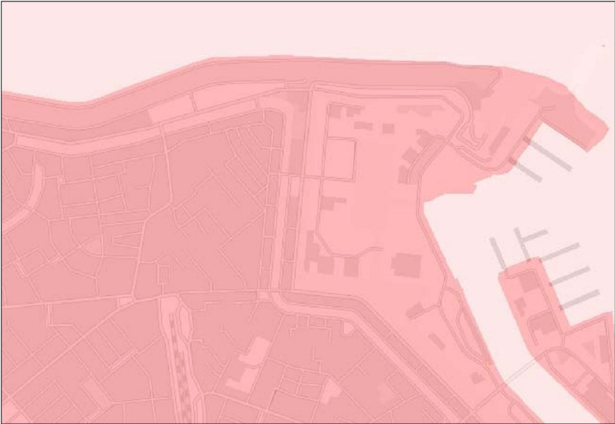
Provinciale Ruimtelijke Verordening Structuurvisie kaart 1 Bestaand Bebouwd Gebied (vastgesteld PS 21-06-2010)